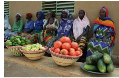
Frauen sind kreditwürdig, wenn sie sich zu gemeinsamen Vorhaben zusammenschließen.

Ibrahim hat einen Mikrokredit im Gegenwert von 150.- Euro bekommen; nicht im Vorbeigehen, sondern nach sorgfältiger Beratung und Prüfung durch den Fachmann der Entwicklungsorganisation. Der Betrag reicht aus, dass Ibrahim in sein kleines Lädchen mit den wichtigsten Artikeln für den Dorfalltag, Gesamtbreite vielleicht drei Meter, zusätzlich ungeziefersichere Lagermöglichkeiten für Getreidesäcke einbauen kann. Jetzt kann er Getreide aufkaufen und solange lagern, bis die Preise saisonal anziehen. Hundert Meter weiter hat sich ein anderer ganz auf diesen Zwischenhandel verlegt. Sein Lagergebäude ist größer. Für Ausbau- und Sicherungsmaßnahmen und das Wellblechdach hat er sich 400.- Euro geliehen. Den größten Mikrokredit hat der Betreiber der dieselgetriebenen Mühle aufgenommen. Immerhin 750.- Euro, aber die Dienste des Müllers werden auch von allen im Dorf in Anspruch genommen, die sich die Knochenarbeit des Stampfens von Mais oder Hirse ersparen wollen. Bei unserem Rundgang ist auch der Rückzahlungsüberwacher der „Brot für die Welt“-Partnerorganisation dabei. Alle Kreditnehmer kennen ihre Rückzahlungspläne. Reichlich 90% der Mikrokreditnehmer schaffen es, sie einzuhalten.