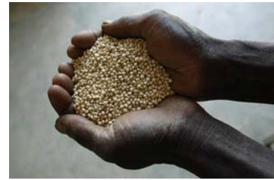
Rispenhirse (Sorghum) ist das Grundnahrungsmittel der Dorfbevölkerung

Da ist er wieder, den Anblick den ich so gern habe. Die ganz eigene Schönheit geernteter Feldfrüchte. In einer langen Reihe von Säcken nebeneinander Hirse, der hirseartige Sorghum, Reis, Mais und dann die verschiedenen Gemüse, von den Frauen gezogen. Aber das ist mehr als ein Stillleben fürs Auge. Auf jedem Sack liegt ein Schild mit peniblen Angaben, an welchem Standort diese Sorte geerntet worden ist, mit welchem Ertrag aufs Kilo genau, in welcher Vegetationsperiode auf den Tag genau. Mir scheint, kein Schädling hat sich diesen Versuchsfeldern nähern können, ohne von Argusaugen entdeckt und gezählt worden zu sein. Jeder Nützlichling wurde registriert und freudig begrüßt.