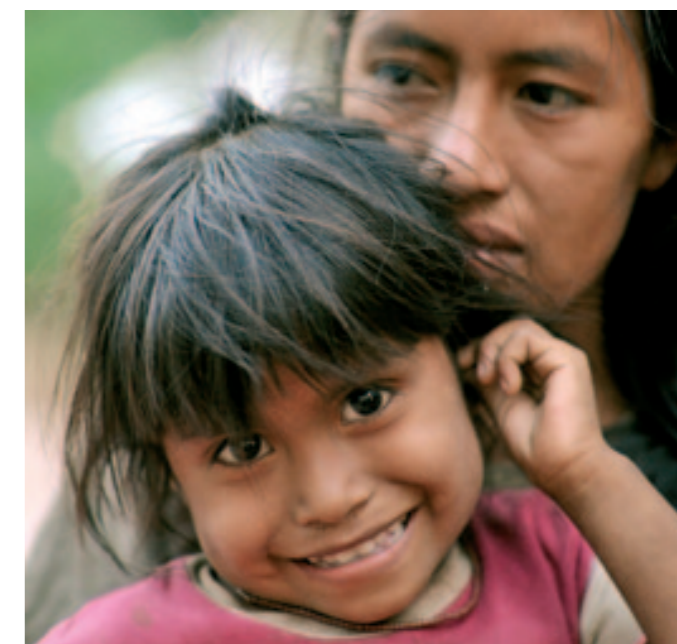
Ungewisse Zukunft: Das Leben der Indigenen im Chaco verändert sich.

www.brot-fuer-die-welt.de/weltweit-aktiv