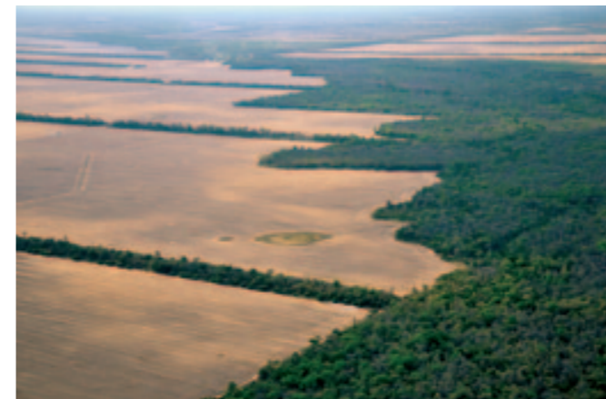
Gerodete Flächen für die Soja-Monokultur.