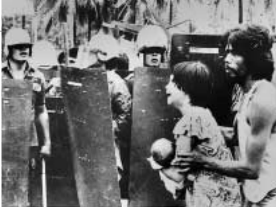
Die Würde des Menschen ist unantastbar...

58 Alle Staaten, wie auch die internationale Staatengemeinschaft, haben die Pflicht, die Menschenrechte zu respektieren, zu schützen und zu gewährleisten. Dies schließt ein, die Schwachen in besonderer Weise zu schützen. Die Anerkennung gleicher Würde, gleichen Wertes und gleicher Rechte gilt für alle Menschen, unabhängig von Geschlecht, Alter, Rasse, Hautfarbe, Herkunft, Religion oder Weltanschauung. Zu den bürgerlichen und politischen Menschenrechten (Zivilpakt) gehören das Recht auf Leben und körperliche Unversehrtheit, auf Religionsfreiheit, auf Meinungsfreiheit und auf den Zusammenschluss zur Wahrung der eigenen Interessen, ebenso das Recht auf Teilhabe an den politischen Entscheidungsprozessen. Aus dem Pakt der Vereinten Nationen über wirtschaftliche, soziale und kulturelle Menschenrechte (Sozialpakt) leitet sich das Recht eines jeden Menschen auf angemessene Lebensverhältnisse, das heißt auf Nahrung, Wohnung, Arbeit, Gesundheit und Bildung, sowie auf die Wahrung der eigenen Tradition und Kultur ab.