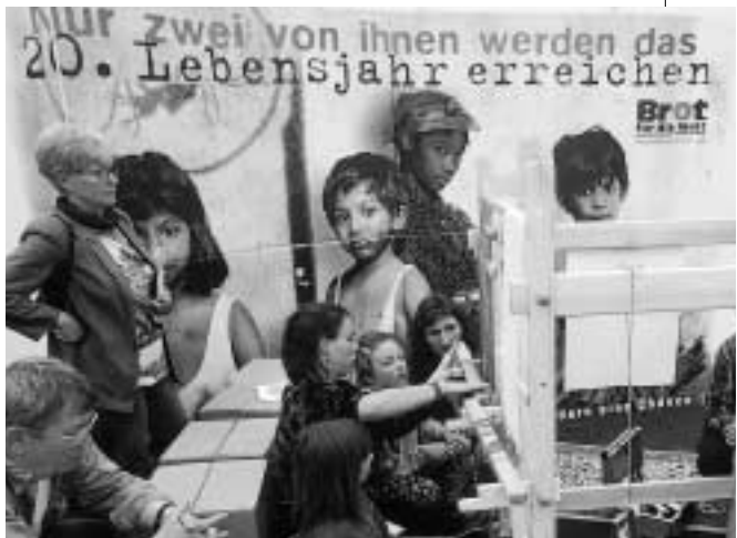
„Brot für die Welt“ beim 28. Deutschen Evangelischen Kirchentag 1999 in Stuttgart

155_ Unterschiedliche Bevölkerungsgruppen und deren Gewohnheiten im Umgang mit Medien machen es notwendig, entwicklungspolitische Bildung sehr differenziert anzubieten. Neben den vertrauten Druckschriften gewinnen zunehmend personale und interaktive Formen an Bedeutung. Hierzu gehören die Internet-Kommunikation, die Förderung von ökumenischen Begegnungen, Angebote, an Kampagnen und Aktionen mitzuwirken sowie Anregungen, Veränderungen im eigenen Umfeld zu bewirken im Hinblick auf eine „zukunftsfähige Gemeinde“ und die Lokale Agenda 21.