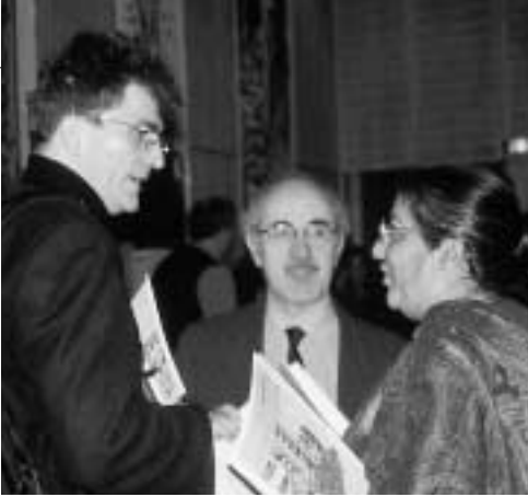
Anlässlich der Partnerkonsultation „Den Armen Gerechtigkeit 2000“ in Stuttgart im März 2000.