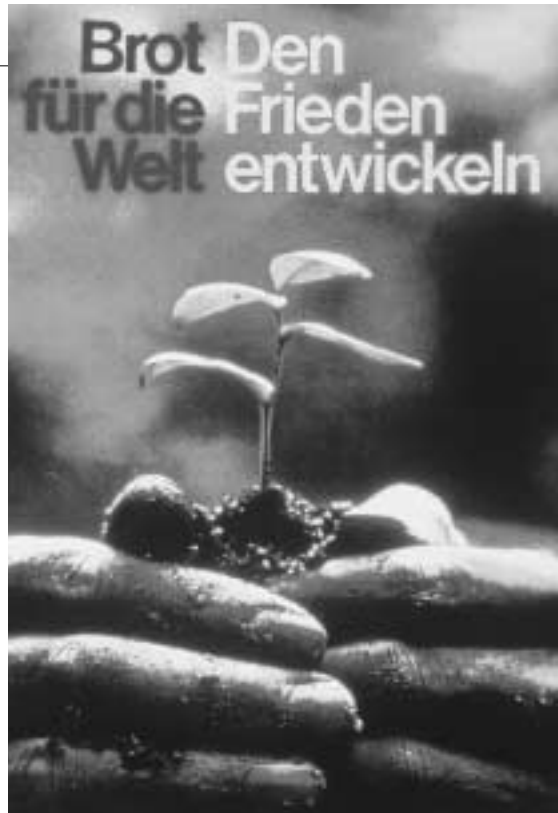
Brot für die Welt: Den Frieden entwickeln – Aktionsplakat der Jahre 1970/71 und 1983

5. Dies sind nur einige Hinweise auf die Veränderungen der neunziger Jahre, die uns – die Mitglieder des Ausschusses für Ökumenische Diakonie und die Mitarbeiterinnen und Mitarbeiter von „Brot für die Welt“ – veranlasst haben, die Erklärung „Den Armen Gerechtigkeit“ zu aktualisieren. Dabei ist jedoch festzuhalten, dass sich die Situation vieler Menschen im Süden kaum verändert hat. Trotz aller Weltgipfel und weltpolitischer Veränderungen sind Armut, Not, Elend und soziale Ausgrenzung keineswegs überwunden. Armut und Verelendung haben in bedrohlichem Ausmaß mittlerweile auch Menschen in Westeuropa und noch krasser in den Ländern Osteuropas in eine verzweifelte Lage gebracht. Insofern sehen wir keinen Anlass, unsere grundsätzliche Orientierung zu verändern.